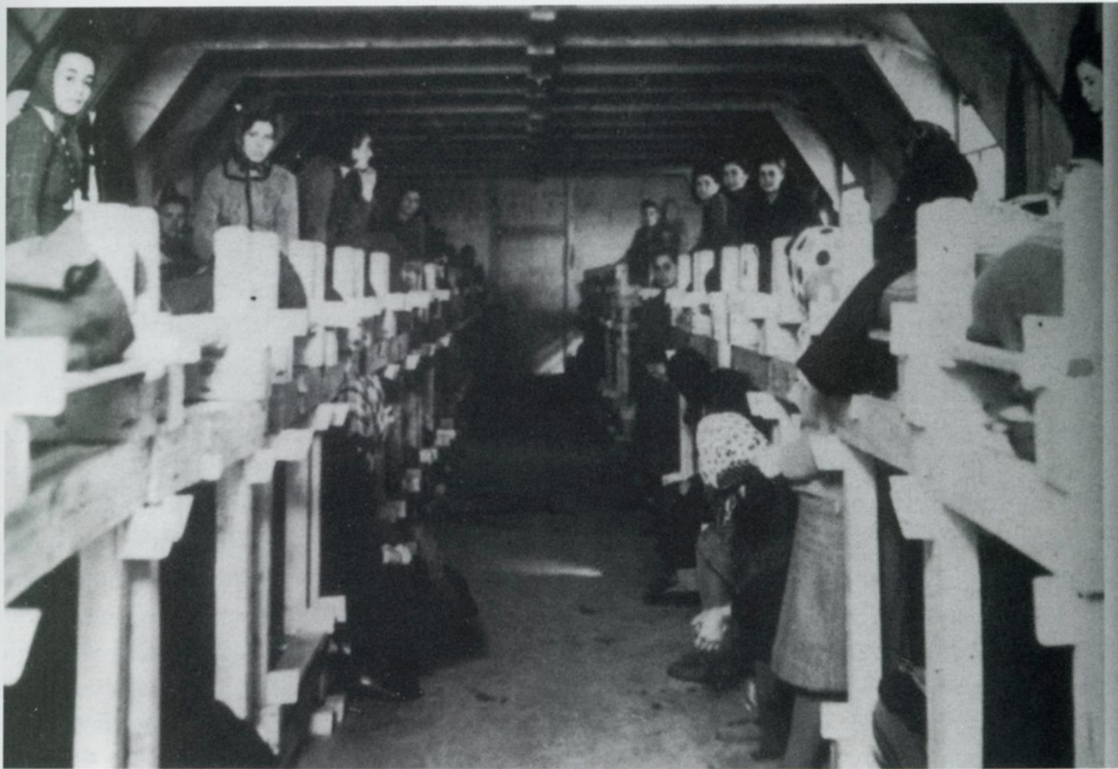
Le donne e i bambini in un internato nel campo di concentramento di Gonars (Udine)