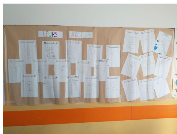
Il Mur des Amis con le foto dei ragazzi belgi e i loro acrostici: i nomi inseriti sotto le foto non sono ancora correttamente abbinati